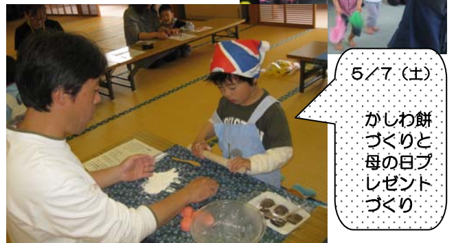
5/7(土) かしわ餅 づくりと 母の日プ レゼント づくり