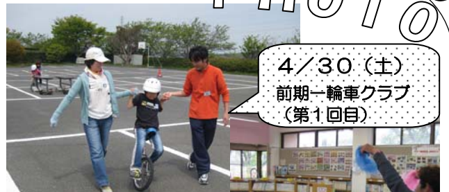
4/30(土) 前期一輪車クラブ (第1回目)