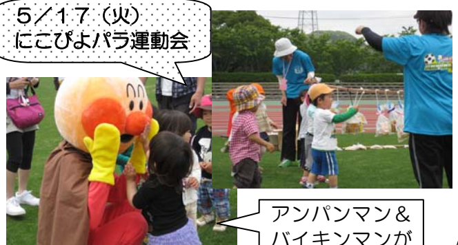
5/17(火) にこびよパラ運動会