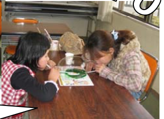
4/9(土) み〜んなあつまれ「ふうせんスライムDEあそぼう!!!」