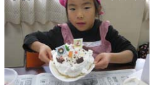
12/10(金) パラカンコ げきじょう「クリスマス会」

★児童館に来たら受付簿に全員(大人も子供も)必ずお名前等記入をお願いします。(災害時等の人数確認の為)