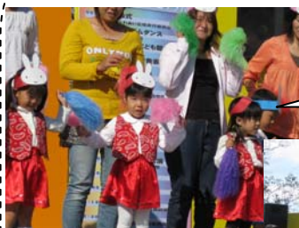
リズム発表 「ミッフィーとおともだち」