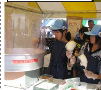
じどうかんテント 「ほかほかショップ」