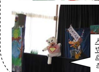
人形劇サークルドレミ「ともだちや」16年間の活動が認められて今回「第28回中日ボランティア賞」を受賞しました。おめでとう!!