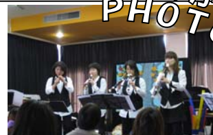
11/22（火）パラカンコげきじょう 「音楽コンサート」

★児童館に来たら受付簿に全員（大人も子供も）必ずお名前等記入をお願いします。（災害時等の人数確認の為）